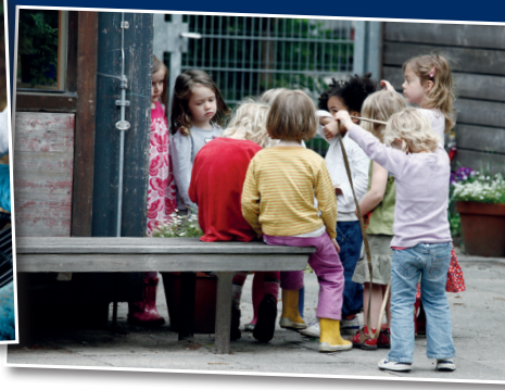
Kinder der Kita an der Fachschule für Sozialpädagogik (FSP2)